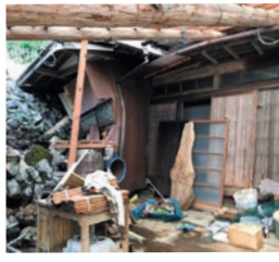
土砂につぶれそうな家屋 (相模原市緑区)