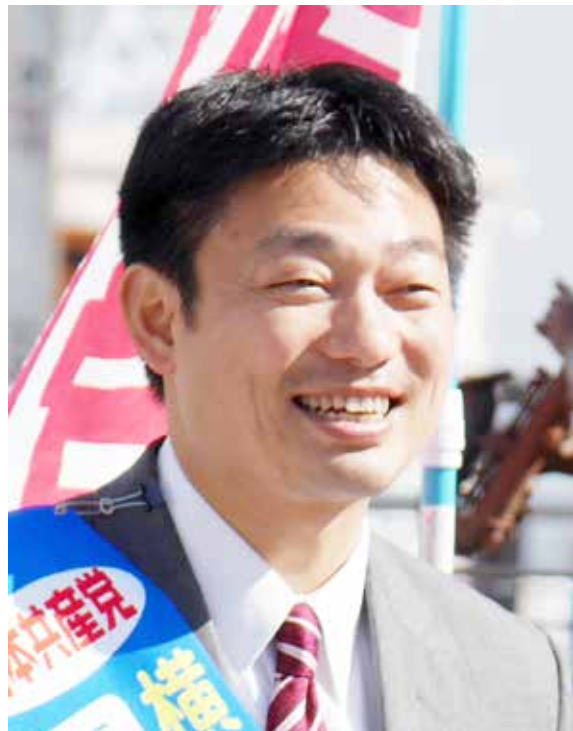
市議団長・県政対策委員長